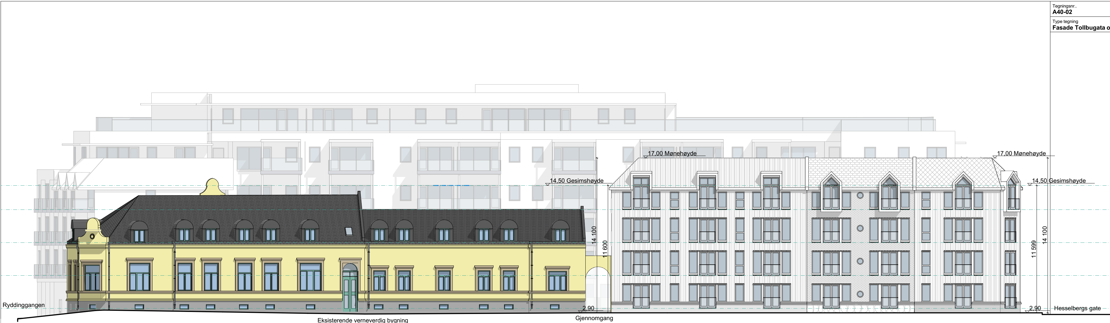
1:200 Fasade Tollbugata