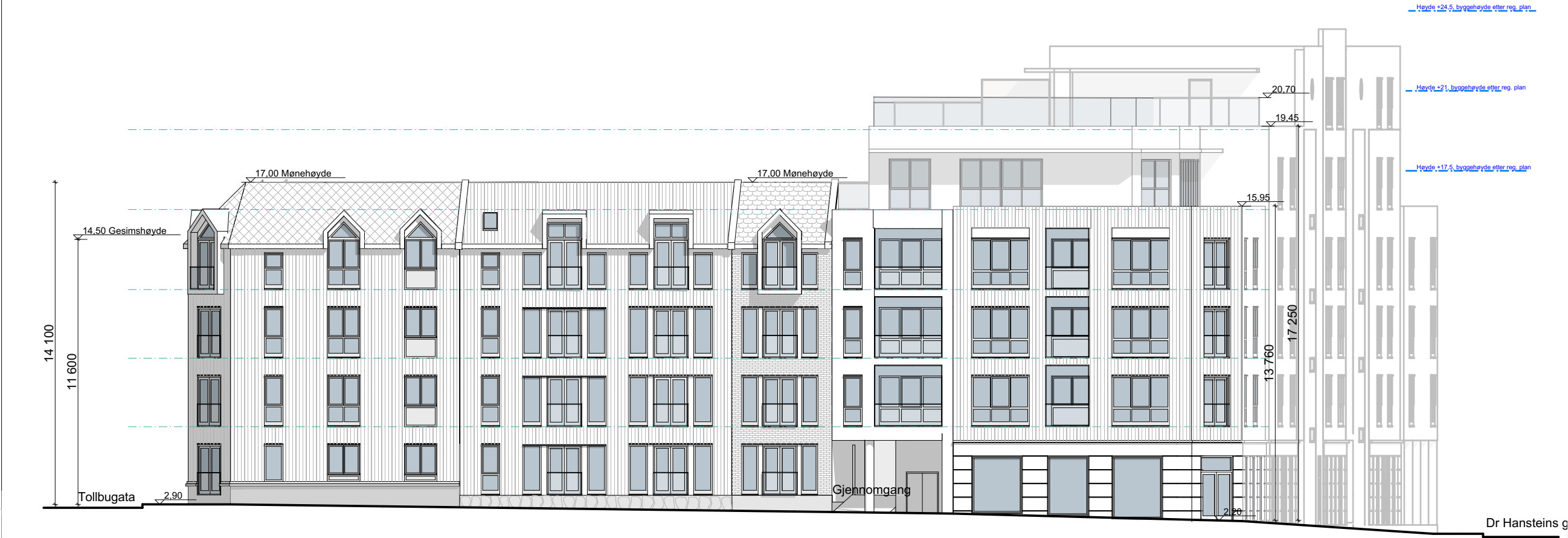
1:200 Fasade Hesselbergs gate

Tegningsnr. A40-02 Type tegning Fasade Tollbugata og Hesselbergs gate